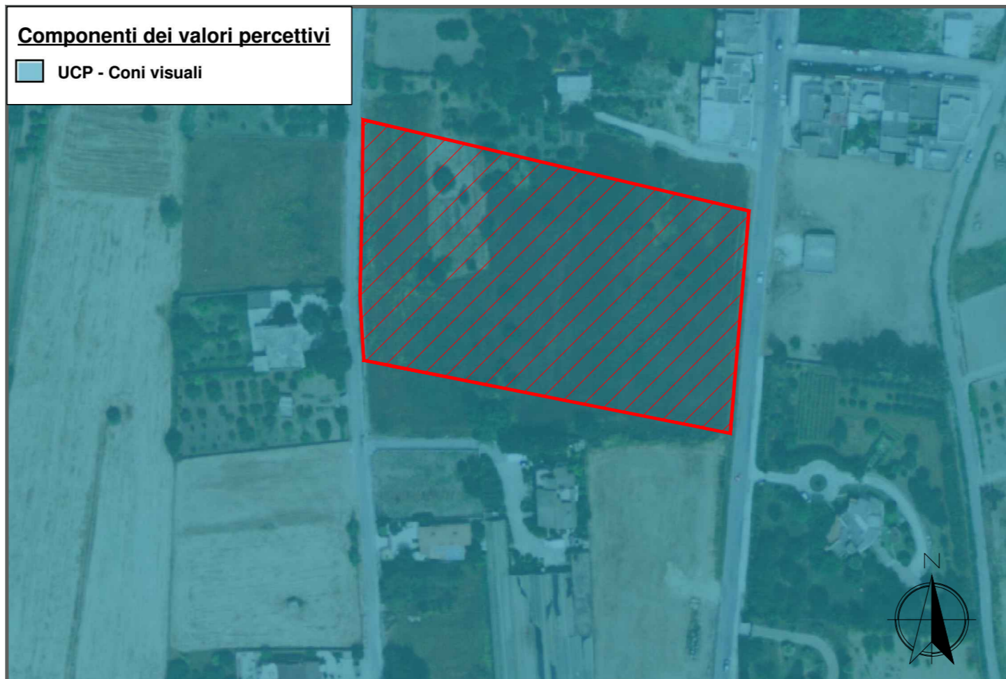
STRALCIO P.P.T.R. con indicazione della zona oggetto d'intervento Vincolo presente: "CONO VISUALE" scala 1:2.000